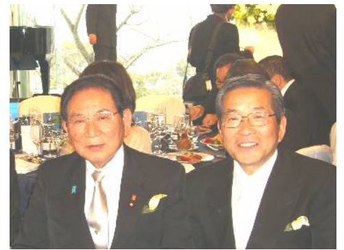
師弟の絆は厚く強い！ 田中慶秋 民主党副代表と (2月25日、ゆず・北川悠仁さんの結婚式で)